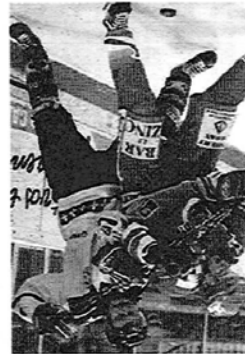
Duresa, a Victòria, / EL 9

La lliga sènior d'hoquei sobre gel va completar aquest cap de setmana la primera volta, amb la constatció que la lliga és una qüestió de tres: el Barça, des de dissabte el nou líder, el JACA, que figura a un sol punt, i el Puigcerdà, que només és a dos punts. A hores d'ara ja ha quedat clar